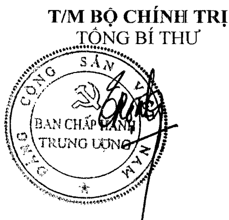
Nguyễn Phú Trọng